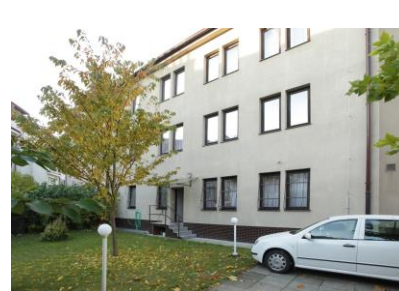
Parkoviště za budovou

Ubytovna Praha 6 Dejvice je vhodná nejen pro studenty, ale i pro turisty a zaměstnance. Můžete se zde ubytovat na krátkodobý i dlouhodobý pobyt. Ubytovna Praha 6 je situovaná 100 metrů od Evropské ulice, poblíž tramvajové, autobusové a vlakové a stanice Nádraží Veleslavin. Na těchto zastávkách stávají tramvaje číslo 2, 20, 26, noční spoj č. 51. a autobus č. 108. Stanice metra Dejvická je vzdálená 10 minut jízdy tramvají.