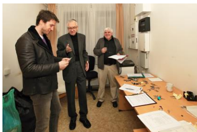
Předání klíčů od budovy

Takže na závěr doporučení pro všechny naše členy, kteří se chtějí kvalitně, lacino a snadno ubytovat v Praze. Jděte na www.a1ubytovani.cz zvolte Praha 6 Dejvice a vyberte si třeba jednolůžkový pokoj za 229 Kč za noc. Nejenže budete spokojeni, ale také podpoříte náš spolek.