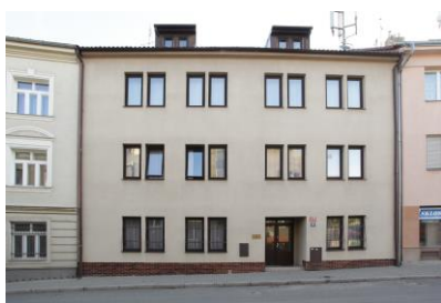
Vchod do budovy