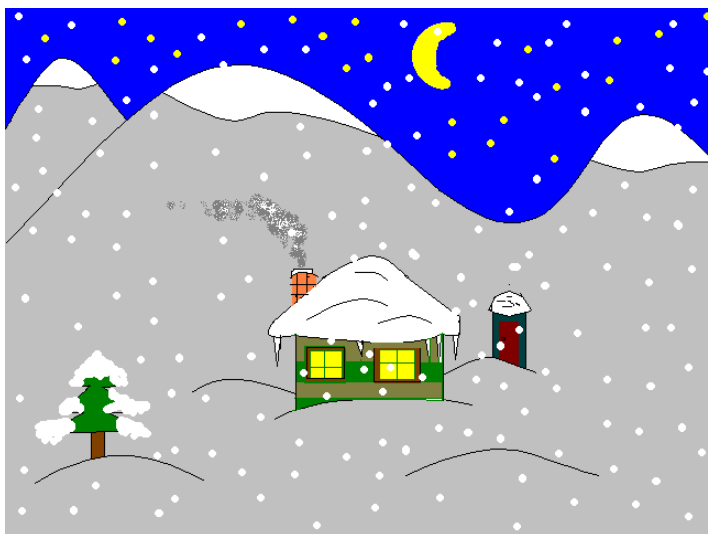
Soutěžní obrázek z loňského Cvrčka.